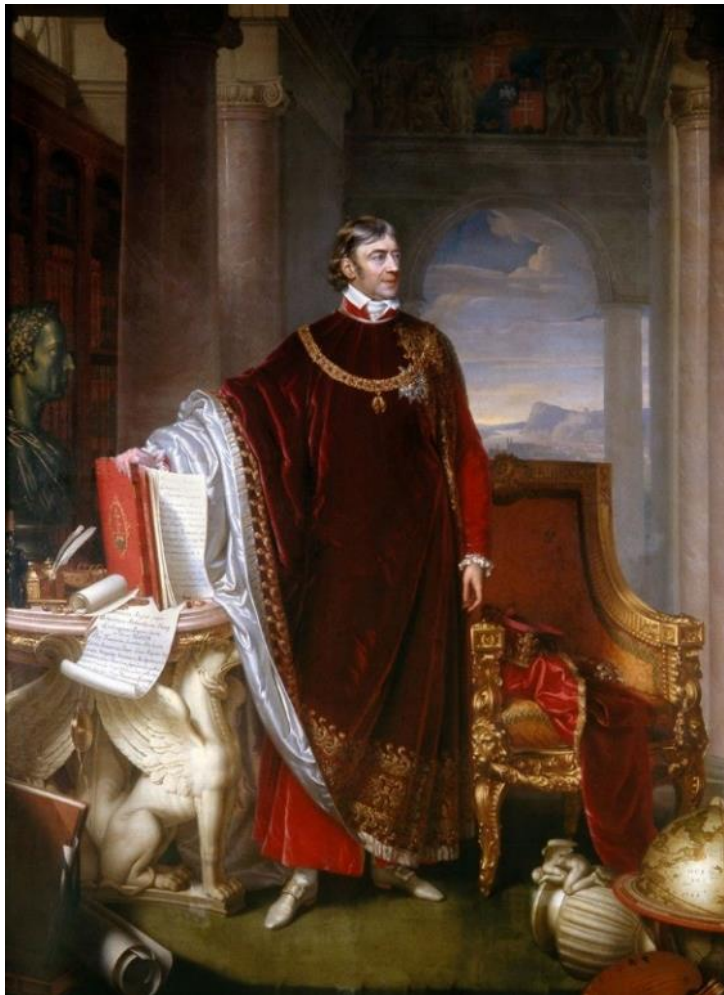
Johann Nepomuk Ender (1793–1854) osztrák romantikus festő portréja Széchenyi Ferencről – részlet